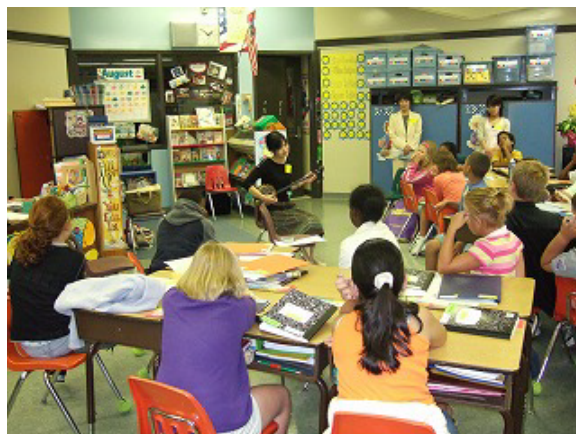
写真3 参加者による日本文化(民謡)の紹介