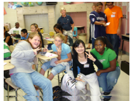
第7学年の生徒と授業者～授業後

第7学年のアメリカの生徒たちは、歌詞朗読や歌唱など積極的に声を発し活動した。日本のことや日本語の音楽に興味津々で、三線を紹介すると大きい反応を示した。三線は見たことも聞いたこともない楽器で最初は戸惑いもあったようだが、チューナーを使用し調弦をしてみせるとギターの調弦のようであり撥もピックと似て、すぐにその音色や三線の伴奏によって繰り広げられる沖縄民謡に惹き付けられ親しんでくれたように思う。授業前、配布する楽譜を読むことができるのか心配だったが、生徒たちは皆すらすらと読譜し、一般音楽の教育も盛んであり教育水準の高さに驚いた。