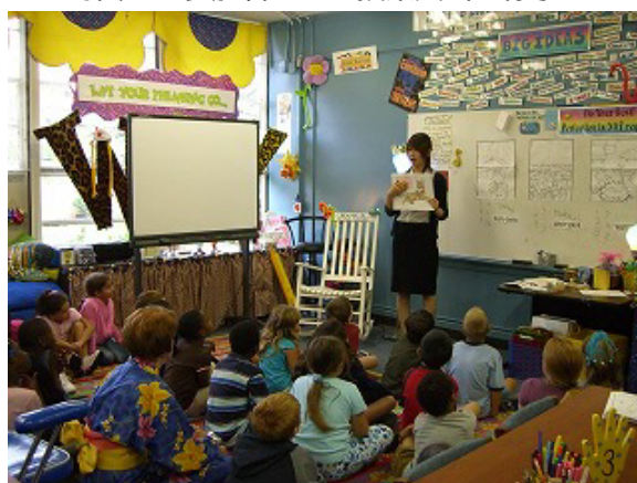
写真2 参加者による授業実践の様子2